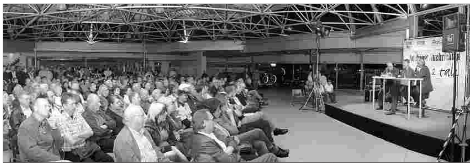
Tivoli-Atmosphäre bei „Time 2 Talk“: Auch bei der zweiten Alemannia-Gesprächsrunde der „Nachrichten“ in der laufenden Saison ist die Halle bei Uko-Automobile mit rund 400 Besuchern pickelvoll.

„In dem großen Stadion in München hat die Stimmung schon mal gelitten, wenn wenige Zuschauer da waren. Der Tivoli hingegen ist einmalig. Deshalb spiele ich lieber hier in Aachen.“