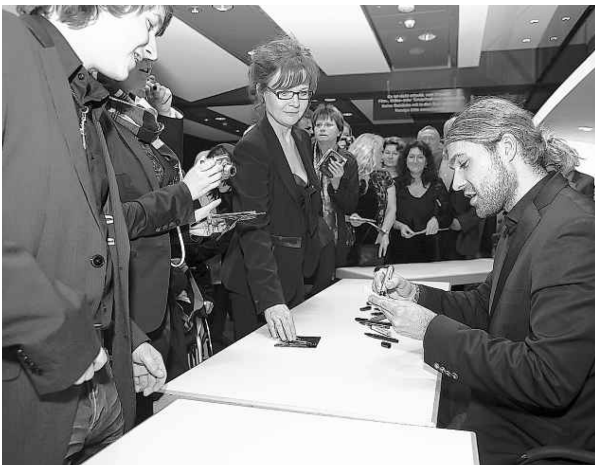
Beim Schreiben so geduldig wie beim Üben für die Konzerte: Geiger David Garrett signierte bei seinem Konzert im Eurogress Autogramme für Fans aller Generationen.