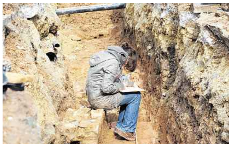
Die Geschichte der Burtscheider Badekultur wird weitergeschrieben: Bei Bauarbeiten der Stawag in der Fußgängerzone werden Mauern eines römischen Thermalbades gefunden.

kerviertel. Bis zu 400 Jahre römisches Aachen bilden sich hier ab, in mehr als zwei Metern Tiefe stoßen die Arbeiter immer wieder auf neue Fundstücke. Überraschend sei dies nicht, in ihrem Umfang sind die Funde aber überaus bedeutend. ► Lokales